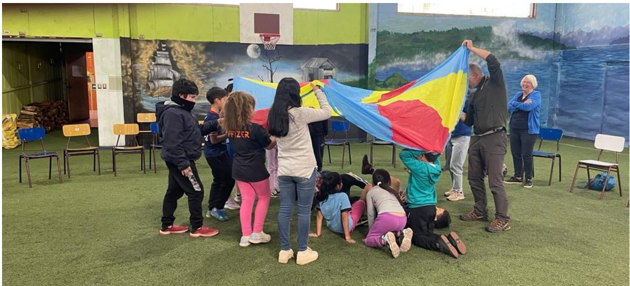
Sport en spel tijdens scholenactiviteiten

Het scholenwerk en de kinder- en jeugdactiviteiten op de basis in Castro lopen naadloos in elkaar over. Kinderen die op school extra ondersteuning nodig hebben worden uitgenodigd voor de kinderkampen of de kinderactiviteiten en rollen zo in een doorlopend trainingsprogramma. Van zes jaar tot ongeveer 22 jaar biedt het team een doorlopende reeks activiteiten zodat kinderen zich ontwikkelen, ze leren hoe ze al vanaf 10 jaar als vrijwilliger mee kunnen helpen bij activiteiten voor jongere kinderen. Een bijzonder systeem dat bijdraagt aan gezonde ontwikkeling. Jonge ouders die zelf altijd naar de kinderkampen gingen, sturen nu hun eigen kinderen of doen een beroep op het team als ze advies nodig hebben in de opvoeding, er sprake is van relatieproblemen of wanneer ze praktische hulp nodig hebben.