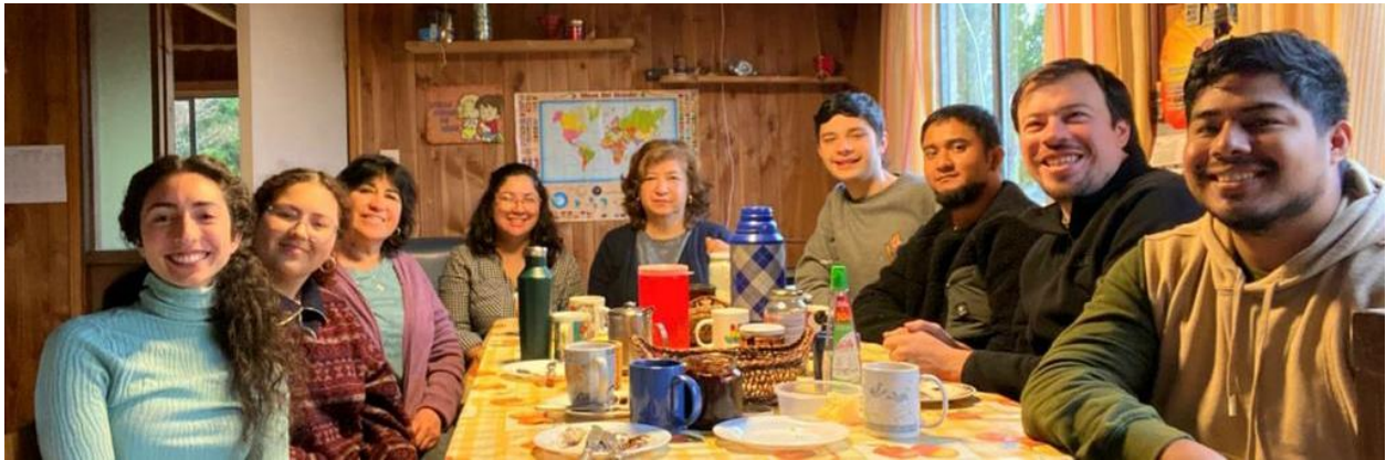
De jongeren van het vormingsprogramma