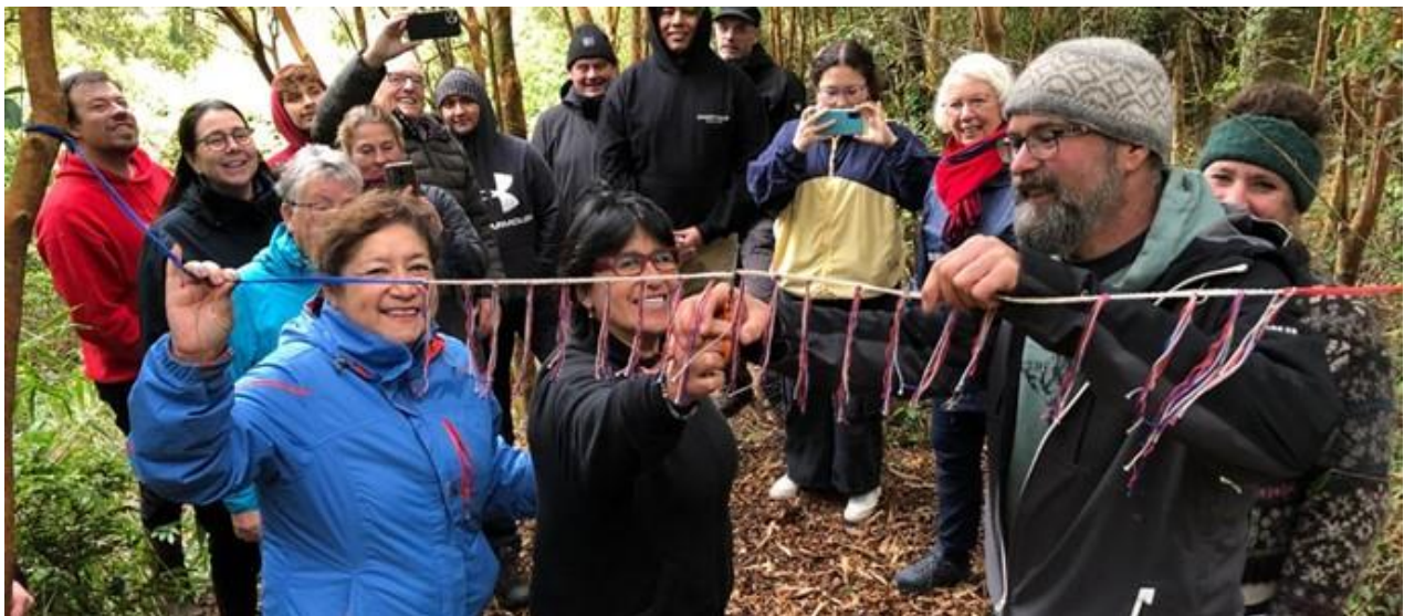
De opening van een bezinningspad door het oerbos op Chulin, aangelegd door de Nederlandse vrijwilligers