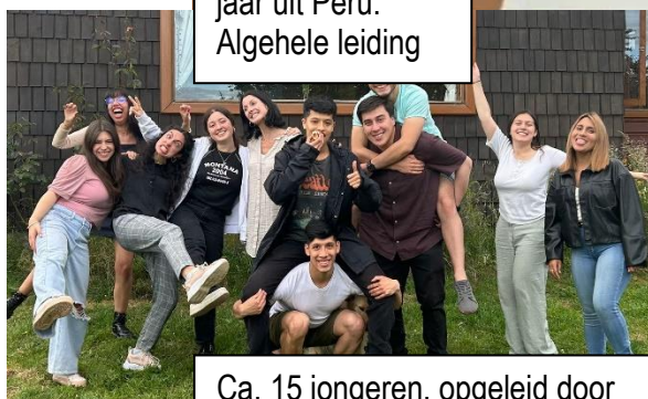
Ca. 15 jongeren, opgeleid door het team, die in hun vakanties tijdens de kinderkampen en de activiteiten bijspringen als vrijwilliger.