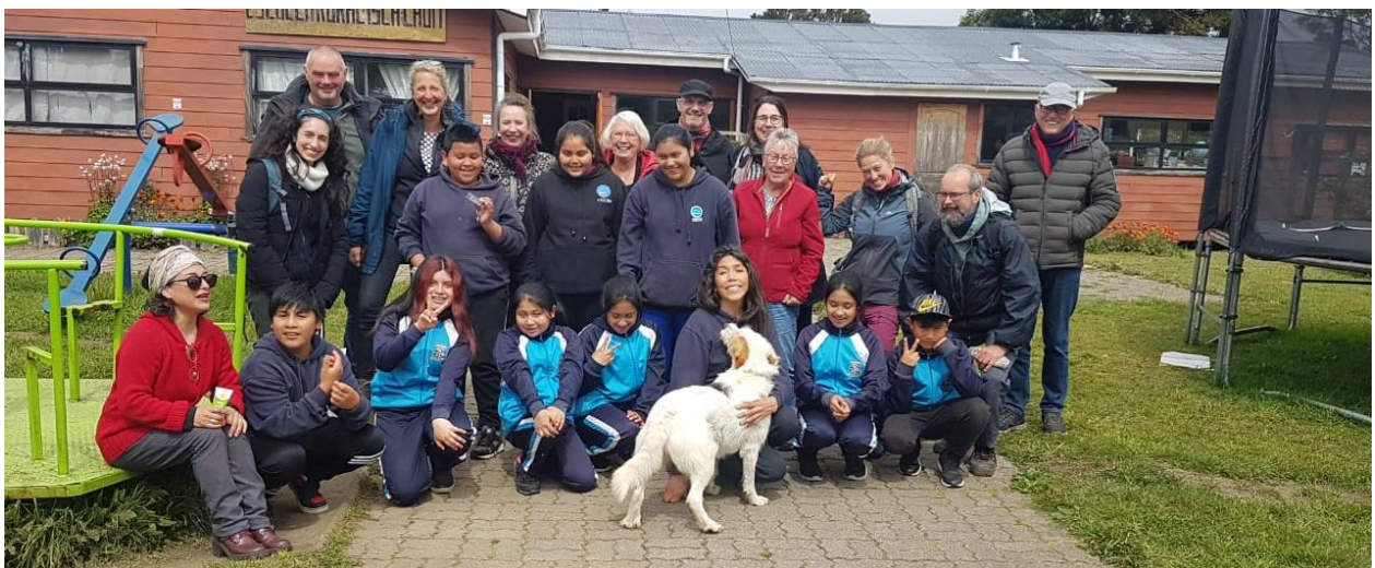
Schoolbezoek tijdens de reis in september

De Nederlandse vrijwilligers staken drie weken lang de handen uit de mouwen. Ze deden onderhoud aan gebouwen, erf en bos, samen met de jongeren van het vormingsjaar. Dit was een feestelijke tijd voor het team én voor de jongeren en er werden bergen werk verzet.